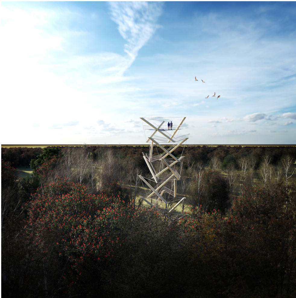
Uitzicht op het Meierijse Peppellandschap de Scheeken.