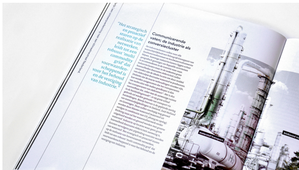
De industrie als conversiecluster.

Bossen, weiden, veen, de Noordzee, allen zijn een natuurlijke vorm van CO 2 -opslag.