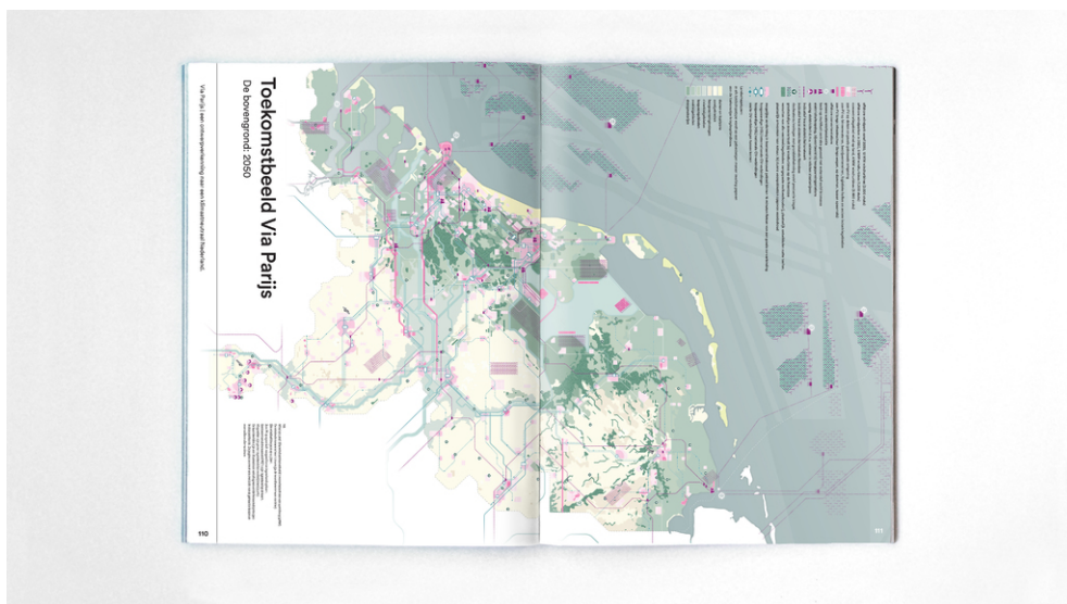
Een mogelijk toekomstbeeld van een postfossiel Nederland; de bovengrond in 2050.