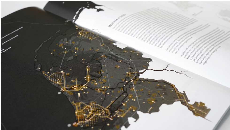
Het warmtesysteem in 2050.