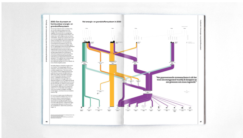
Het energie- en grondstoffsysteem in 2050.