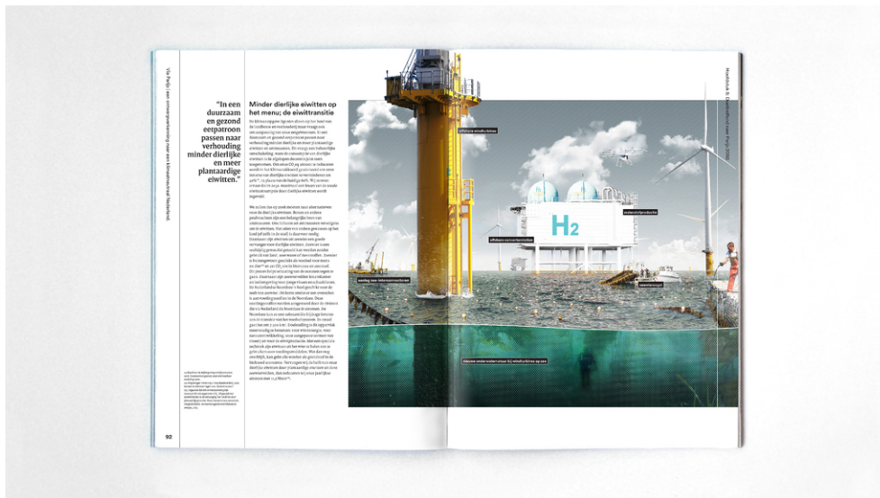
De toekomst van de Noordzee, windturbinevelden, zeewiertscheiding en waterstofconversie.