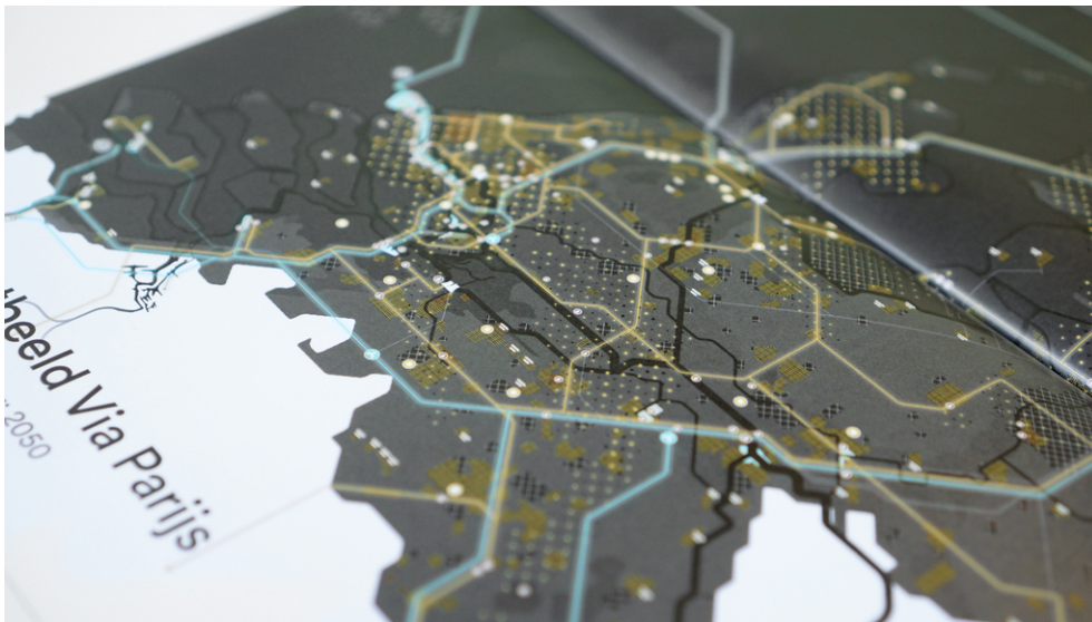
Een ontwerpverkenning naar een klimaatneutraal Nederland.

Er wordt in Nederland hard gewerkt om ruimte te maken voor de overgang naar een duurzaam energiesysteem. Gemeenten, provincies, waterschappen en Rijkspartijen werken samen in dertig Regionale Energie Strategieën (RES-en) om tot voorstellen te komen voor de opwekking van duurzame elektriciteit, de warmtetransitie in de gebouwde omgeving en de daarvoor benodigde opslag en infrastructuur.