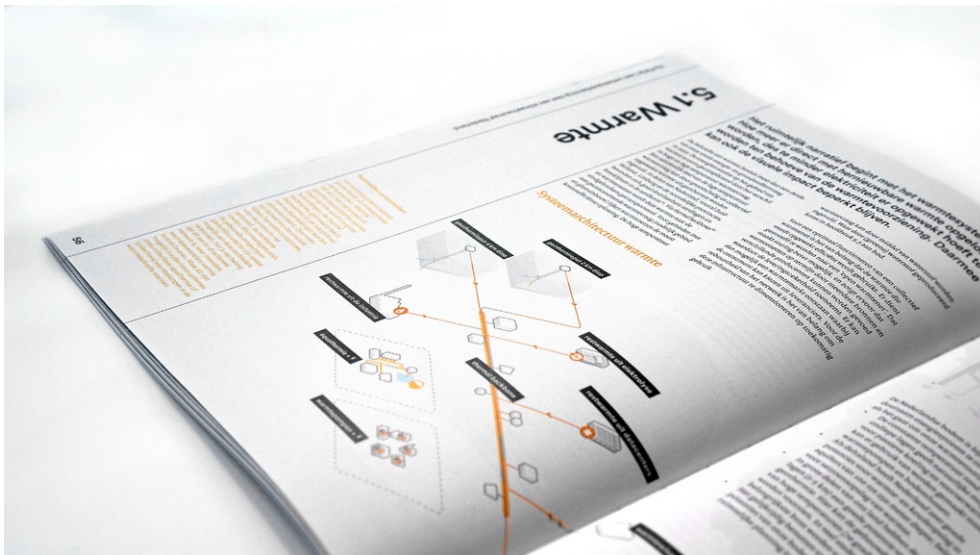
De ruimtelijke componenten van het warmtesysteem.