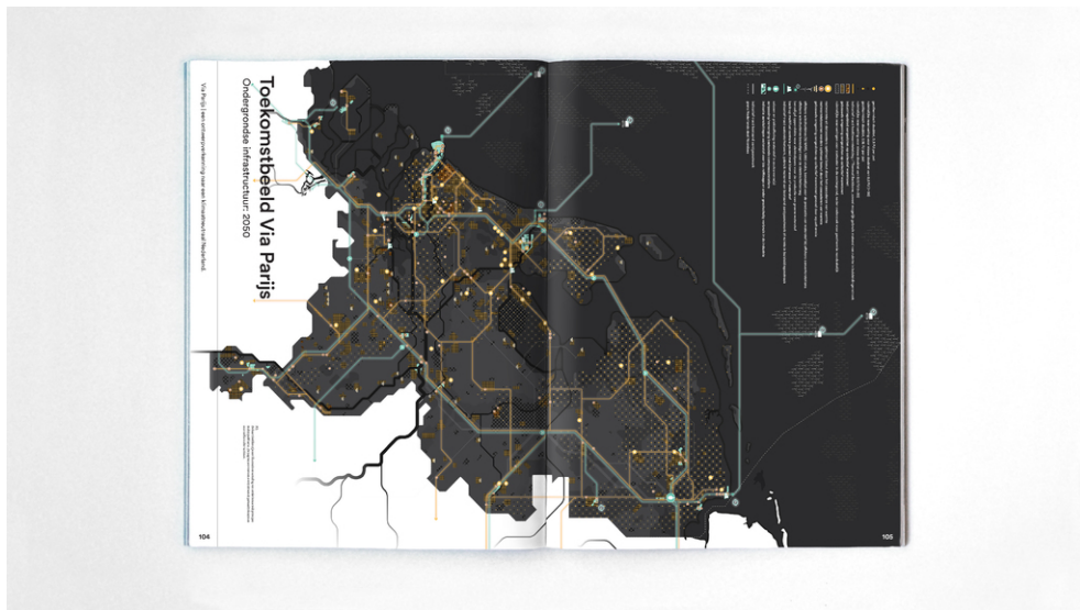
Een mogelijk toekomstbeeld van een postfossiel Nederland; de ondergrond in 2050.

De energietransitie kan leiden tot een contrastrijker Nederland en niet tot meer eenvormigheid.