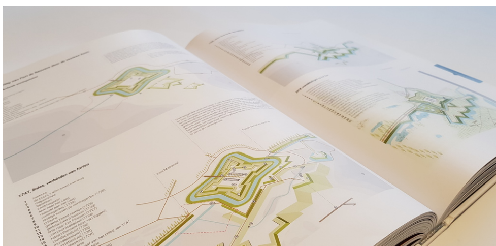
Een exemplaar is aan te vragen bij de Provincie Noord-Brabant.