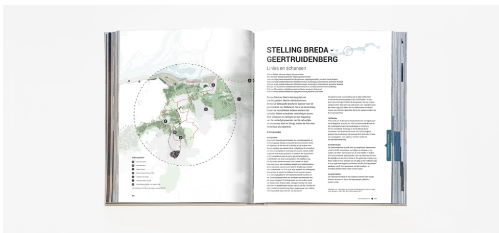
Een preview van het 349 pagina's tellende boekwerk.