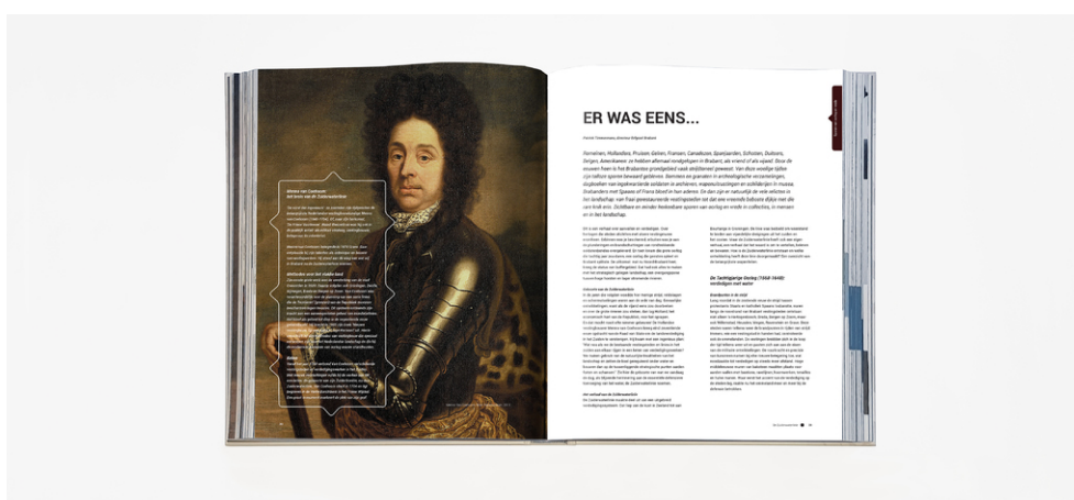
Een preview van het 349 pagina's tellende boekwerk.