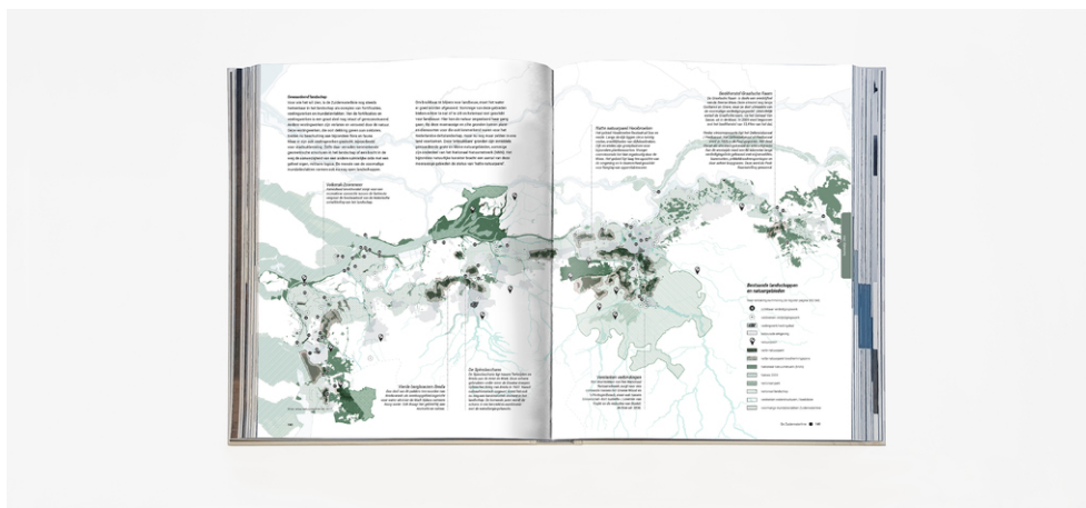
Een preview van het 349 pagina's tellende boekwerk.