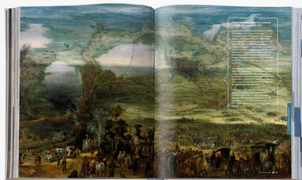
Een preview van het 349 pagina's tellende boekwerk.