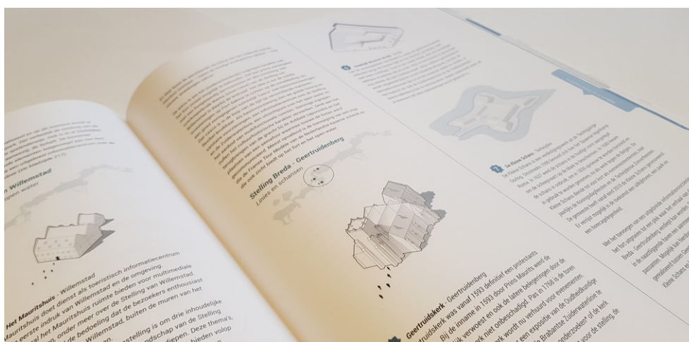
Een exemplaar is aan te vragen bij de Provincie Noord-Brabant.