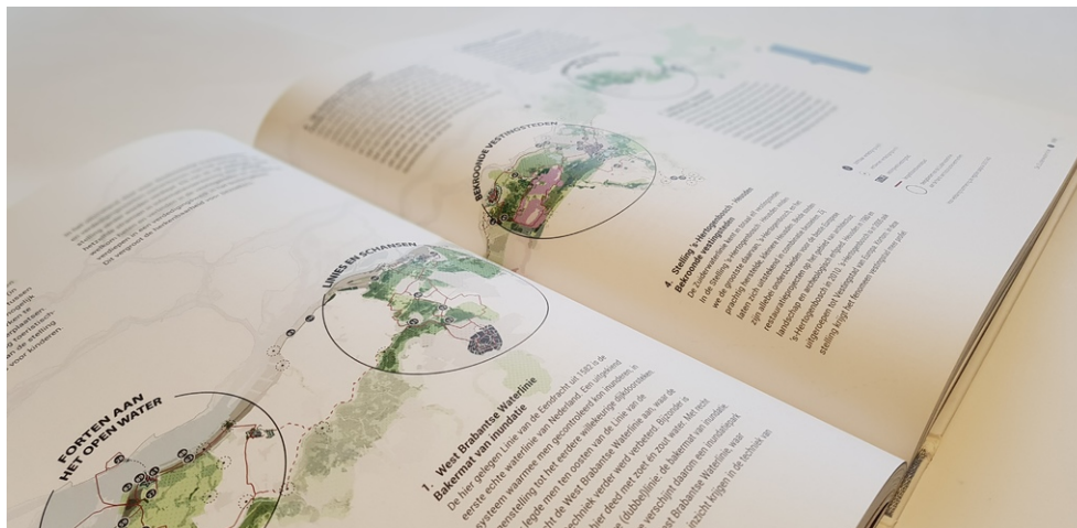
Een exemplaar is aan te vragen bij de Provincie Noord-Brabant.