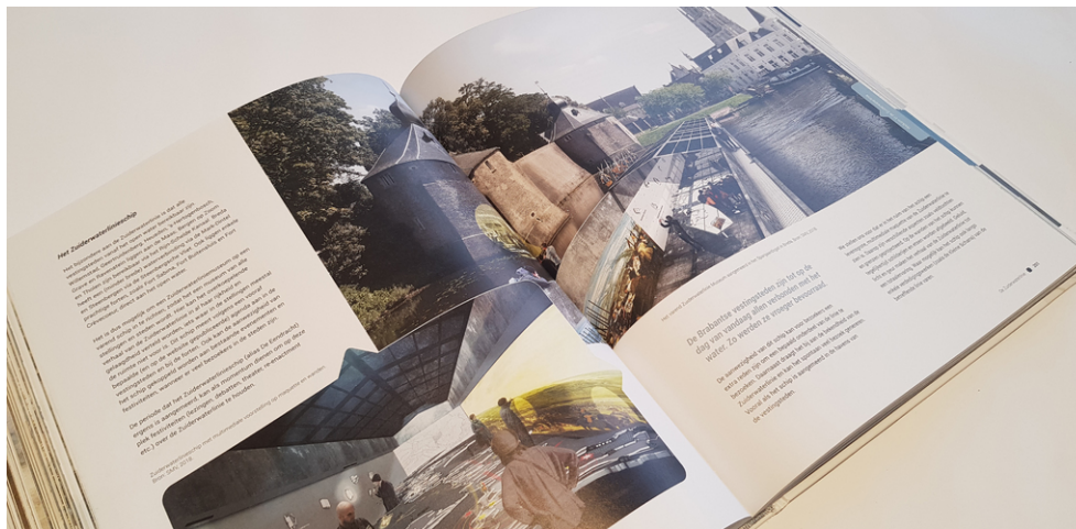
Een exemplaar is aan te vragen bij de Provincie Noord-Brabant.