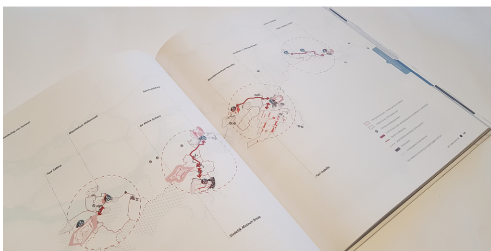
Een exemplaar is aan te vragen bij de Provincie Noord-Brabant.