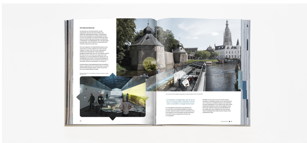
Een preview van het 349 pagina's tellende boekwerk.