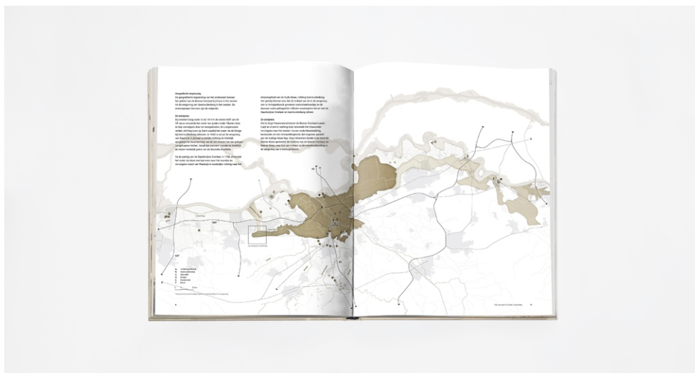
Een preview van enkele bladzijden van het 300 bladzijden dik boekwerk.