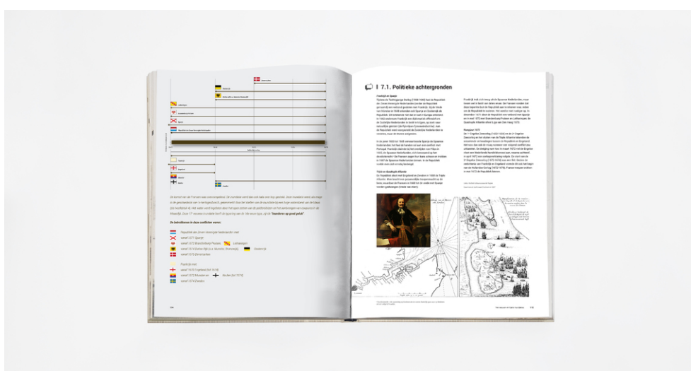
Een preview van enkele bladzijden van het 300 bladzijden dik boekwerk.