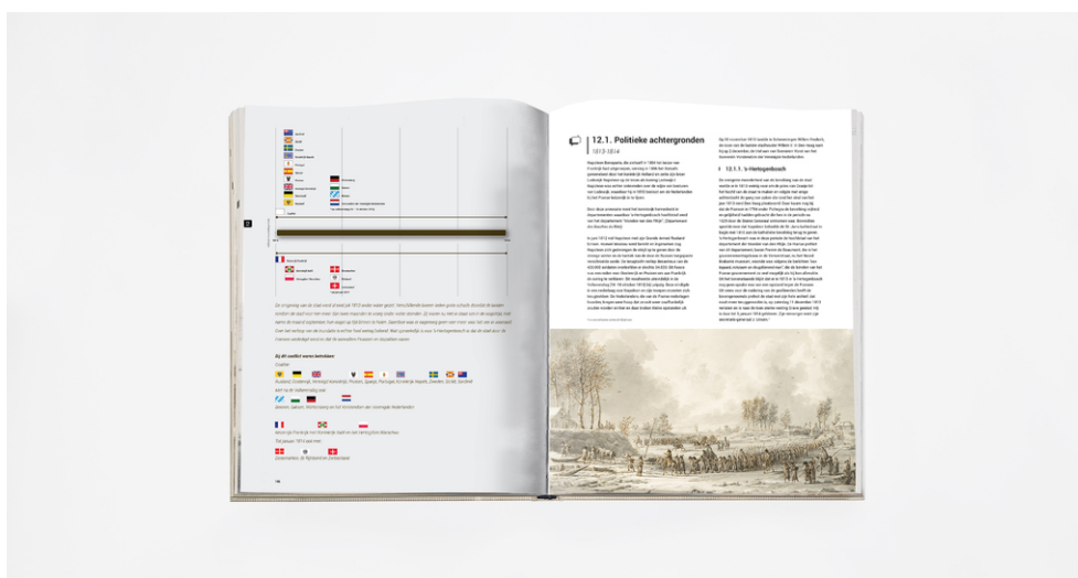
Een preview van enkele bladzijden van het 300 bladzijden dik boekwerk.