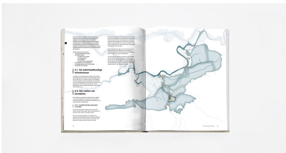
Een preview van enkele bladzijden van het 300 bladzijden dik boekwerk.