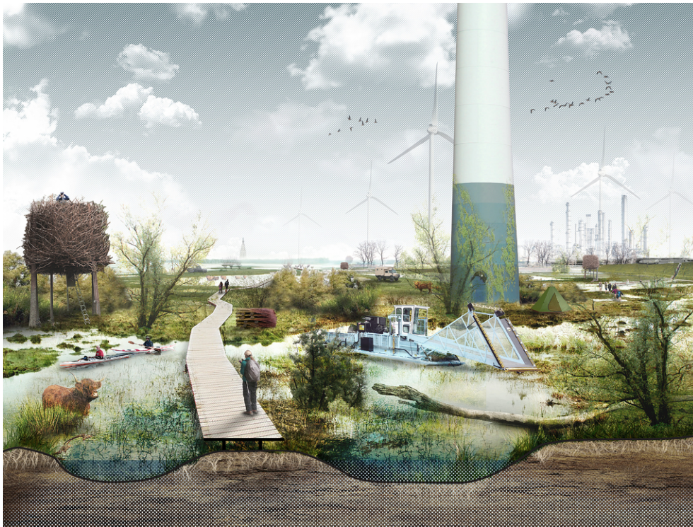
Het amfibisch landschap met op de achtergrond Breda.