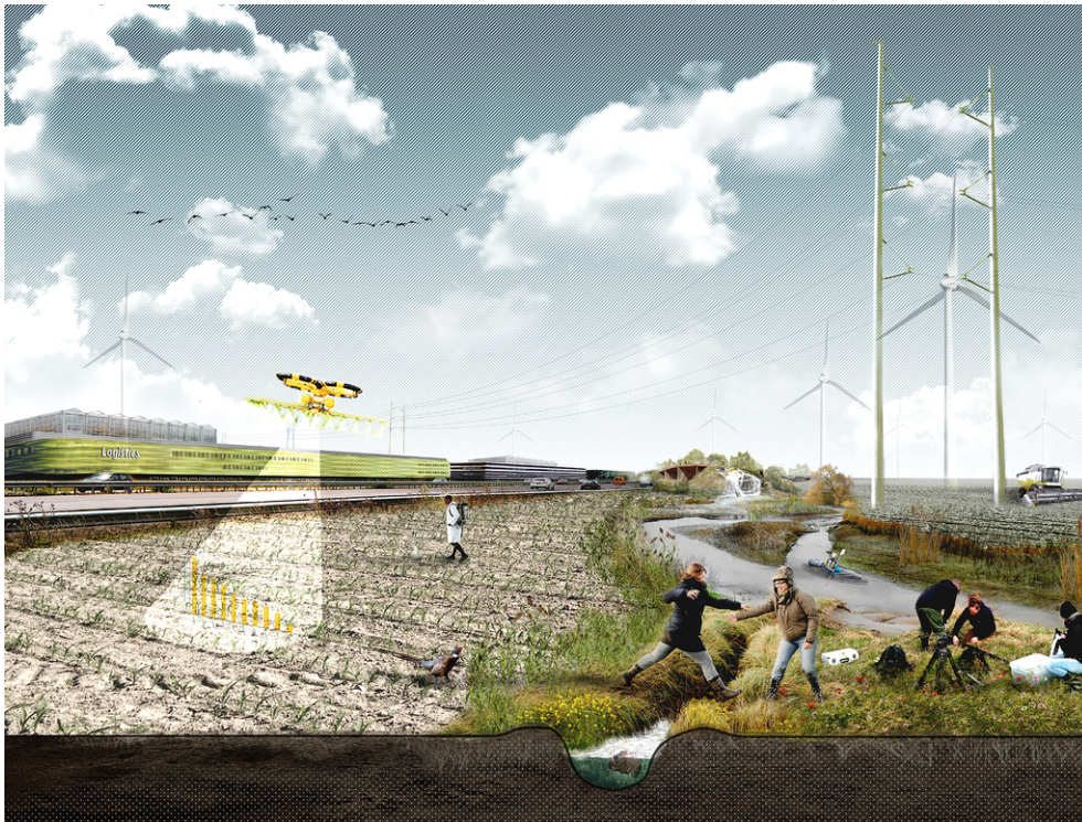
Het kreekenlandschap / transformatielandschap nabij Logistiek Park Moerdijk