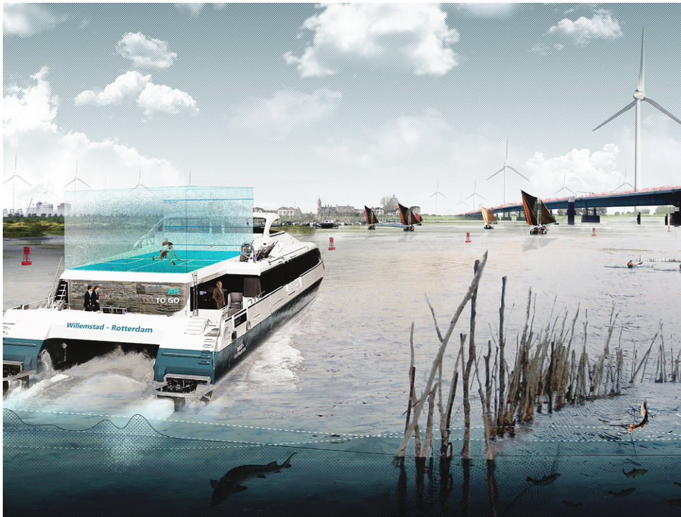
Zicht op Willemstad vanaf het Hollands Diep als forens tussen de Rotterdam en West-Brabant.