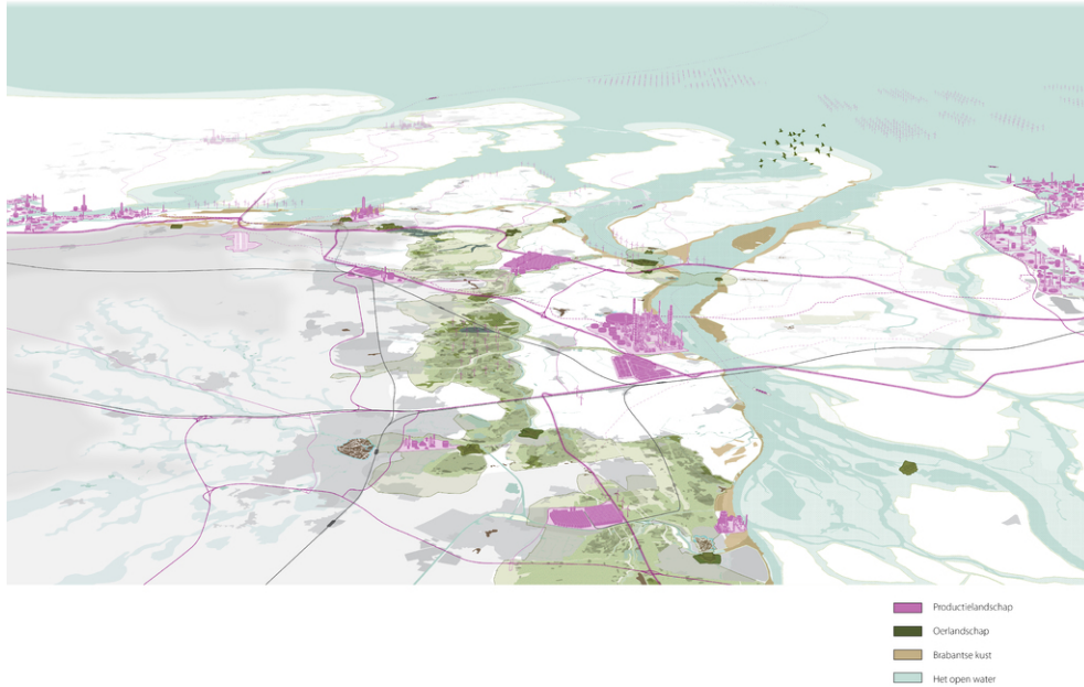
Best of three worlds: Birdseye view van het voorstel voor het West-Brabantse Landschap

West-Brabant is ook een landschap van stromen, sporen, buizen en wegen waarlangs mensen, goederen en grondstoffen onderweg zijn tussen Rotterdam, Antwerpen en Brabantstad. Het open landschap biedt ruimte aan de teelt van suikerbieten en aardappelen. Maar ook aan chemische clusters, logistieke parken en grootschalige glastuinbouw. Ook historisch gezien fungeerde West-Brabant vaak als doorgangsgebied en militaire bufferzone. Op weg naar de Hollandse en Zeeuwse steden werden de Spanjaarden en Fransen op afstand gehouden door grote aaneengesloten gebieden te inunderen.