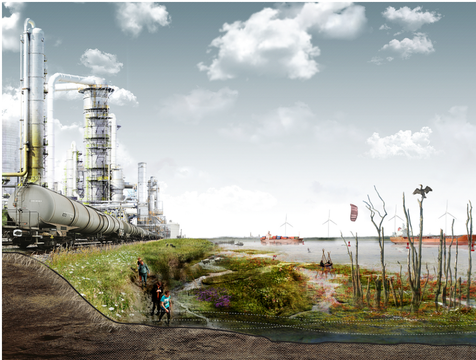
Slikken en schorren langs het Schelde- Rijnkanaal.

Door middel van ontwerpend onderzoek trachten wij antwoorden te geven op bovenstaande vragen. Wij denken dat schaal daarbij een belangrijke rol speelt. Veel van de huidige gewaardeerde landschappen zijn te gefragmenteerd en hebben onvoldoende ruimtelijke identiteit. De schaal van bedrijvenclusters en infrastructuur vraagt om een verblijfs- en recreatielandschap van formaat. Dit kan grotendeels worden gecreëerd door bestaande landschappen te versterken en te verbinden. Daar waar de bestaande landschappelijke, cultuurhistorische en infrastructurele structuren elkaar kruisen, ontstaan onverwachte knopen, overgangen en spannende contrasten.