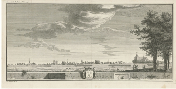
Gezicht op Bergen op Zoom, Jan Caspar Philips, naar Abraham de Haen (II), 1740