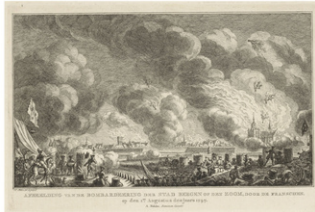
Bombardement van Bergen op Zoom, 1747, Simon Fokke, naar Cornelis Pronk, 1772