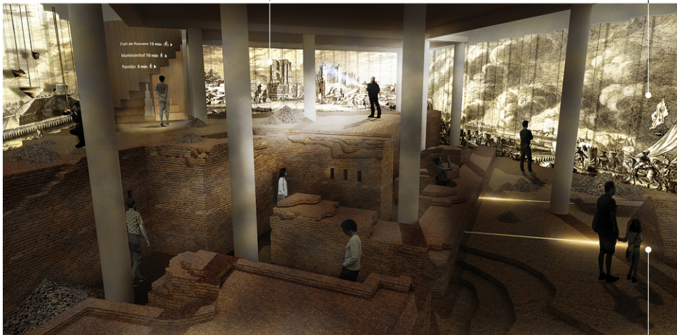
Picture of Bastion Coehoorn, one of the many bastions around Bergen op Zoom. Afbeelding van de linkerrand van het Bastion Coehoorn, een van de vele bastions rondom Bergen op Zoom.

Op 12 juli 1747 begon het Beleg van Bergen op Zoom door de Fransen. Mijnen werden aangelegd welke tot ontploffing zouden worden gebracht onder de buitenwerken van de vesting. Dit konden de Nederlanders doen doordat Coehoorn een permanent tegenmijnenstelsel had laten aanleggen.