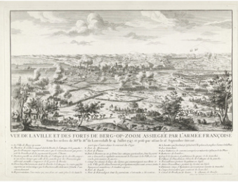
Beleg van Bergen op Zoom, 1747, Martin Marvie, naar S. Brouard