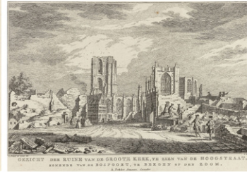
Ruïne van de Grote Kerk van Bergen op Zoom, 1748, Simon Fokke, naar Cornelis Pronk, 1772