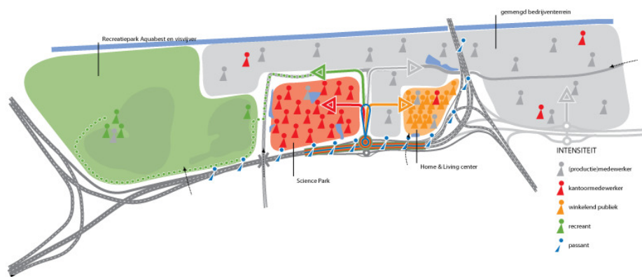
grote diversiteit aan gebruikers