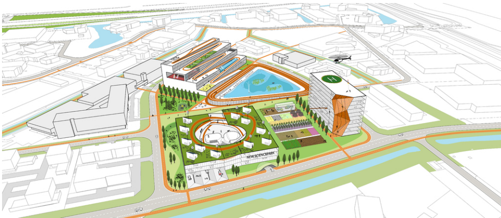
Het nieuwe hart van Science Park Eindhoven