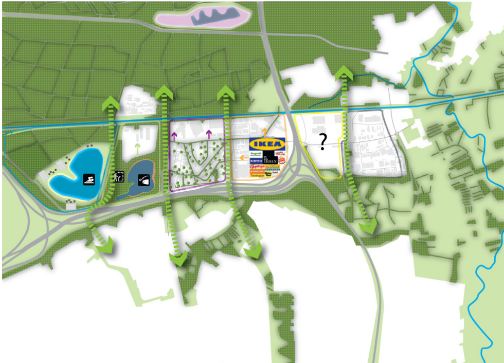
aanzet tot visievorming

bij hun werkomgeving is groot - zij vormen initiatieven van nieuw en verrassend gebruik van het werklandschap. Het Werklandschap groeit daarmee door naar een Vrij Leeflandschap - een nieuw type stedelijk landschap met eigenzinnige karaktertrekken.